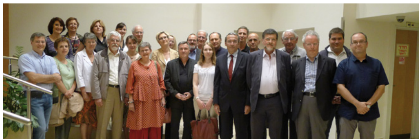
La délégation de Strasbourg lors du voyage d'études à Ramat-Gan en mai 2011.

Le FSJU est joue un rôle majeur dans la recherche de solutions destinées à aider les personnes âgées.